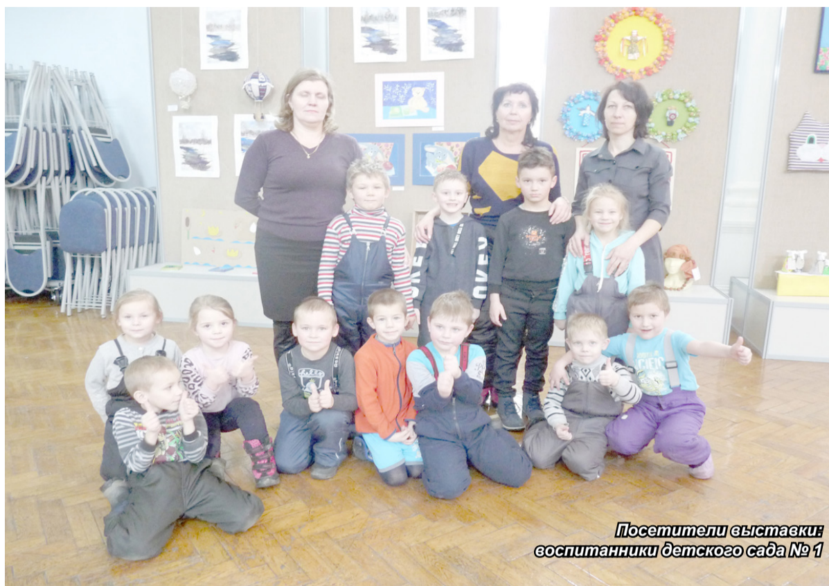
Посетители выставки воспитанники детского сада № 1

В начале марта в выставочном зале филиала ДШИ «Художественное отделение» открылась выставка ежегодного открытого районного конкурса – фестиваля семейного творчества и изобразительного искусства «Папа, мама, я – творческая семья». Конкурс стал традиционным и проводится ежегодно с 2011 года. Организаторы мероприятия – отдел по культуре, молодежной политике, спорту и туризму администрации Подпорожского района и филиал