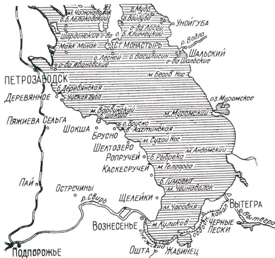
Онежское озеро. Район боевых действий Онежской Военной флотилии

Фронт стабилизировался в районе Ошты. 28 ноября 1941 года флотилия была расформирована, её корабли вошли в состав Волжской военной флотилии